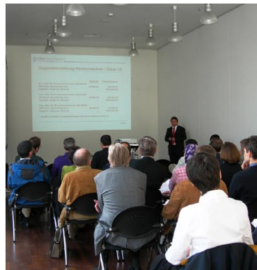
Gutbesuchte Weiterbildung: Ein Workshop an der IFAS

welche vom 24. bis 27. Oktober 06 in Zürich stattgefunden hat. FMH und FMH Services