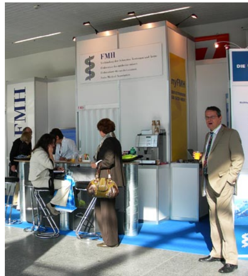
Willkommener Zwischenhalt: Stand der FMH an der IFAS

Gut 15 500 Interessierte haben die IFAS (Fachmesse für Arzt- und Spitalbedarf) besucht,