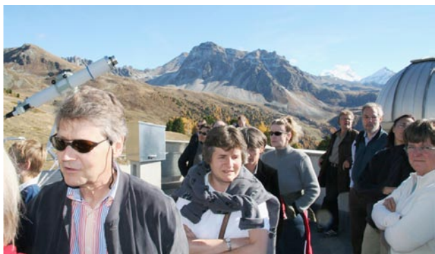
Zentralvorstand und Kader (mit Begleitung) im Val d'Anniviers

Einem herzlichen Empfang durch die Stadt- und die Kantons-Behörden folgte am nächsten Tag ein herbstlicher Ausflug in das Museum der Gianadda-Stiftung in Martigny, in die Höhen des Val d'Anniviers - und in die Tiefen eines Weinkellers.