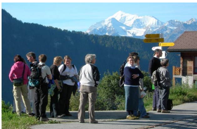
Das Generalsekretariat auf der Suche nach dem Safran

Generalsekretariats nach Mund, das Safran-Dorf oberhalb von Brig. Noch blühten nicht viele Pflanzen, und doch war der Safran an diesem Tag omnipräsent - im Likör, dessen Herstellung uns demonstriert wurde, dann aber auch im Risotto, im Brot oder im Dessert.