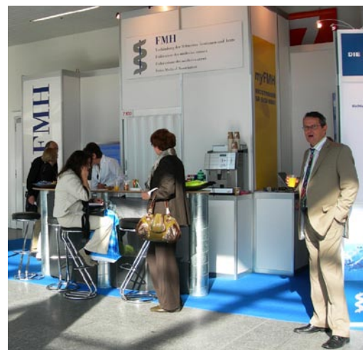
Arrêt bienvenu: stand de la FMH à l'IFAS

Plus de 15 500 personnes se sont rendues à l'IFAS (Salon spécialisé des équipements médicaux et