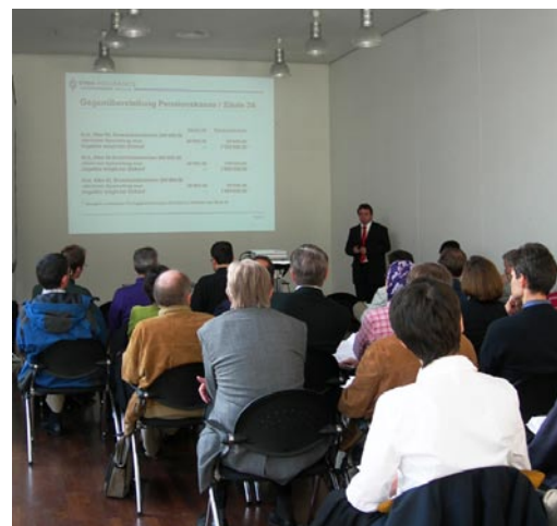
Formation bien fréquentée: un atelier à l'IFAS

hospitaliers) qui s'est tenu du 24 au 27 octobre 2006 à Zurich. La FMH et FMH Services y furent