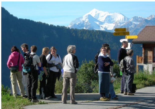
Le Secrétariat général sur la piste du safran

La FMH s'est rendue en Valais deux fois cet automne: la traditionnelle course de bureau a conduit les collaborateurs du Secrétariat général à Mund, le village où l'on cultive le safran, au-dessus de Brigue. Même si peu de pousses étaient en fleurs, le safran s'est trouvé partout ce jour-là, dans la liqueur dont la fabrication nous a été montrée, dans le risotto, sur le pain et même au dessert.