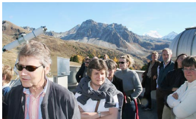
Comité central, cadres et accompagnants au Val d'Anniviers

lieu aux alentours de Sion. Un chaleureux accueil nous a été réservé par les autorités communales et cantonales, suivi le lendemain d'une excursion automnale alliant à la visite de la fondation Giannadda à Martigny, les hauteurs du Val d'Anniviers, et les profondeurs d'une cave viticole.