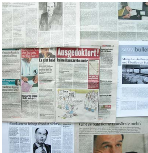
Présence de la FMH et de son président dans les médias