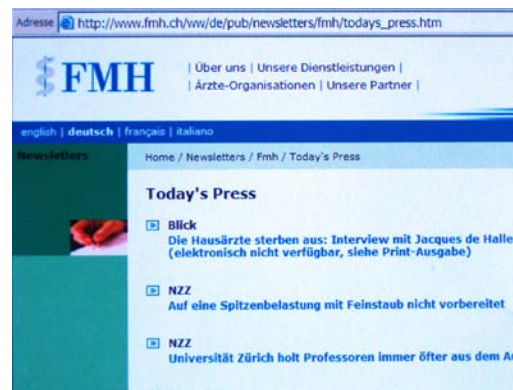
Actualité quotidienne: La revue de presse de la FMH

Today's Press: connaissez-vous ce service quotidien et gratuit de la FMH? Non? Alors il serait grand temps de vous y abonner afin de découvrir notre revue de presse consacrée à différents