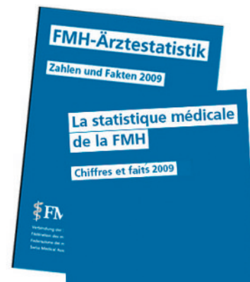
Chiffres et faits – la nouvelle statistique médicale 2010 sera publiée en mars

projets émanant des cabinets médicaux et des cliniques ou des entreprises actives dans le domaine de la santé. Depuis cette année, le Swiss Quality Award est décerné conjointement par la FMH, l'Institut de recherche évaluative (IEFM) de l'Université de Berne et la Société Suisse pour le Management de Qualité dans la Santé (SQMH). La philosophie reste toutefois la