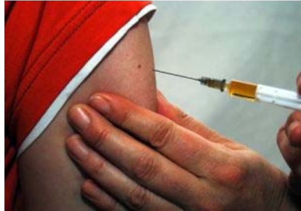
Ärzte leisten Qualitätsarbeit

Bern/Zürich (pte/23.06.2010/13:03) - Gerade für den Ruf der Ärzteschaft ist die Einhaltung von Qualitätskriterien und gewisser Standards maßgeblich. Die Öffentlichkeit verlangt dabei immer öfter nach mehr Transparenz. Die Mediziner selbst stellen sich aber ein gutes Zeugnis in Qualitätsfragen aus. Wie die Verbindung der Schweizer Ärztinnen und Ärzte FMH http://www.fmh.ch im Rahmen des Projekts Q-Monitoring aufzeigt, "leisten Ärzte im Dienste ihrer Patienten umfassende Qualitätsarbeit". In der Hausarztmedizin, der Psychiatrie und Orthopädie sei das Engagement vielfältig und weitgehend stark.