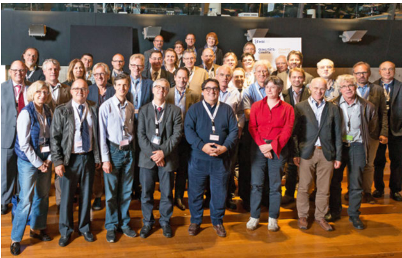
Feierlicher Akt an der Ärztekammer vom 27. Oktober 2016: Vertreterinnen und Vertreter der unterzeichnenden Ärzteorganisationen der Qualitäts-Charta SAQM (Quelle: Frederike Asael).